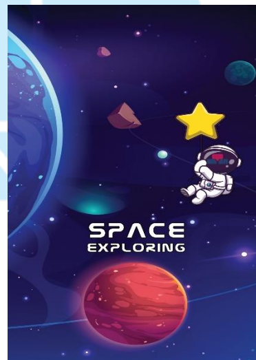
دوره دانش آموزی (هفتم، هشتم، نهم)