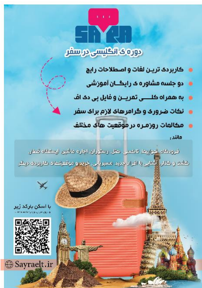
دوره ی انگلیسی در سفر (۱)