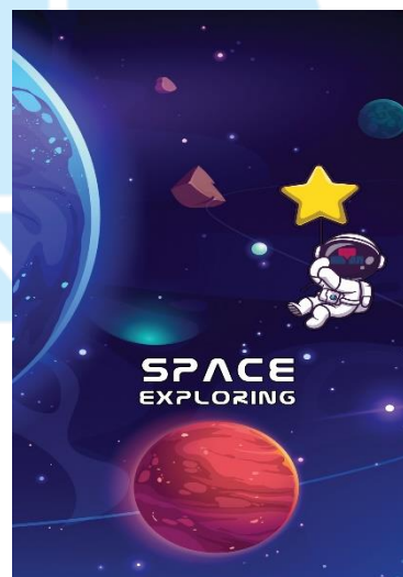
دوره دانش آموزی (هفتم، هشتم، نهم)