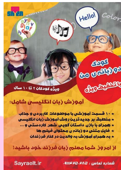
دوره کودک دوزبان من